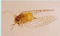
Homoptera, Psyllidae: ninfas se desenvolvem no interior das bromélias.

2- Zoologisches Institut, Universität Tübingen, Alemanha, anne.zillikens@uni-tuebingen.de