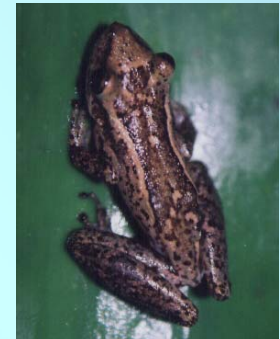
Anura, Hylidae: Scinax alter , comum em bromélias.