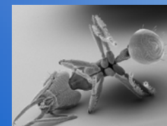
Formicidae: Strumigenys sp., predadores de colêmbolas, foto de varredura.