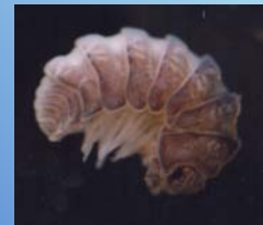
Isopoda, Armadillidae: crustáceo que vive no húmus do interior das bromélias.