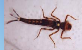
Leptagrion andromache : ninfas se desenvolvem na água das bromélias.