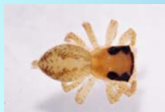
Salticidae: aranhas frequentes em bromélias.