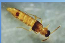
Staphylinidae: segunda família de Coleoptera mais abundante nas bromélias.