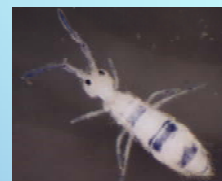
Collembola, Entomobryidae: família típica de bromélias.