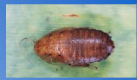
Blattaria: desenvolve-se no interior das bromélias.