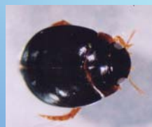
Coleoptera, Dytiscidae: pequenos besouros aquáticos, típicos de bromélias.