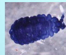
Collembola Hypogastruridae: família rara nas bromélias.