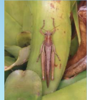
Orthoptera, Acrididae em Aechmea .