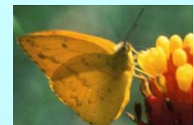
Lepidoptera, Pieridae: um dos visitantes florais de Aechmea lindenii .

As bromélias têm grande importância na manutenção da biodiversidade da fauna na Mata Atlântica, já que a disposição de suas folhas em roseta forma um reservatório onde se acumulam água e matéria orgânica, criando microhabitats para muitos organismos. Um grande número de invertebrados se desenvolve no interior das bromélias e alguns vertebrados utilizam a bromélia como abrigo ou local de forrageio. As espécies de animais encontradas, invertebrados e vertebrados, abrangem 38 ordens.