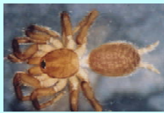
Mygalomorphae - Caranguejeira: Aranhas raras em bromélias.