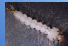
Diptera, Culicidae: as larvas se desenvolvem na água das bromélias e são predadas por diversos animais.