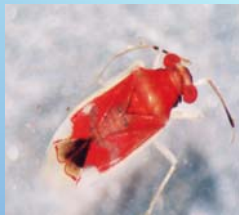
Miridae: hemiptera fitófago que utiliza as bromélias como hospedeiras.