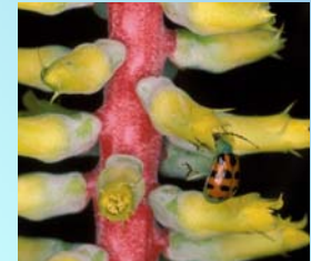
Coleoptera, Crysomelidae: visitante floral de Aechmea nudicaulis .