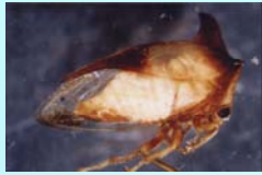
Homoptera, Membracidae: visitante ocasional das bromélias.